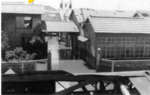
伊勢湾台風の被害（昭和35年）

この台風により、日本の災害対策を根本から見直し、1961年には「災害対策基本法」が公布され、防災計画の作成、災害予防、災害発生時の対策や救援、復旧等の基本がまとめられることとなりました。