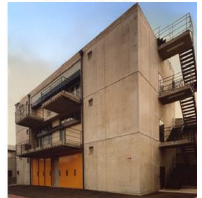
当時の第二 新工場