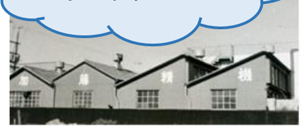
ノコギリ屋根の工場